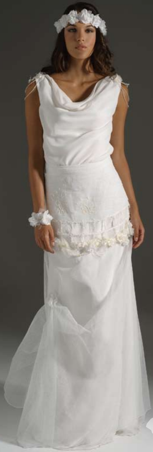
•• GENTIANE ••