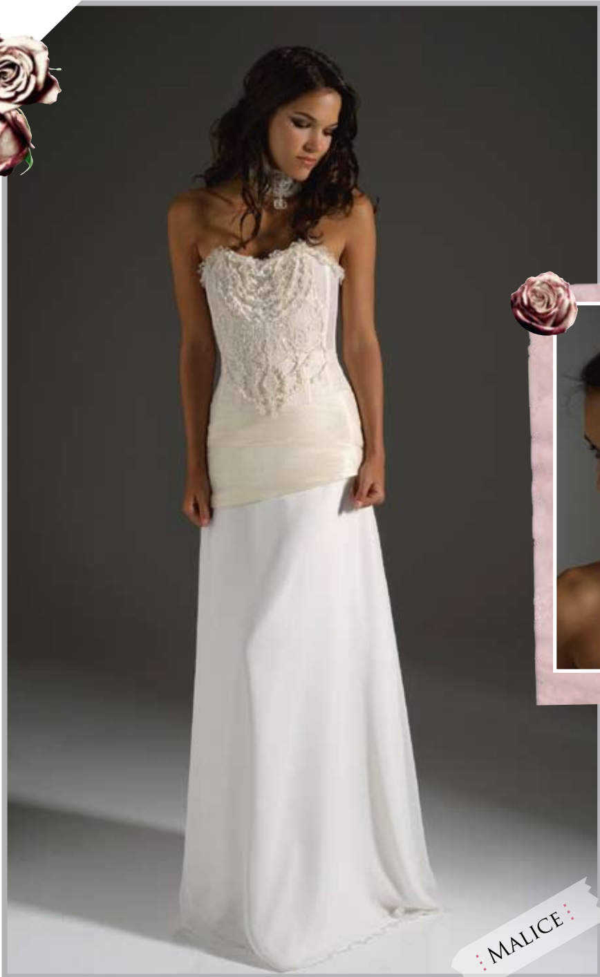
• MALICE •